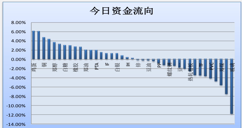
图一：当日资金流向概览

地址：北京市东城区东直门南大街3号国华投资大厦8层 国都期货有限公司 网址：www.guodu.cc